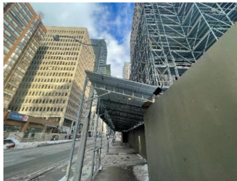
La passerelle couverte est illustrée ci-dessus.

Saviez-vous que... La passerelle couverte devrait rester en place au moins jusqu'à l'été 2023 pour assurer la sécurité du public. PCL est en train de monter l'échafaudage et de terminer les travaux de restauration des pierres patrimoniales à l'intérieur de l'échafaudage, puis de démonter l'échafaudage.