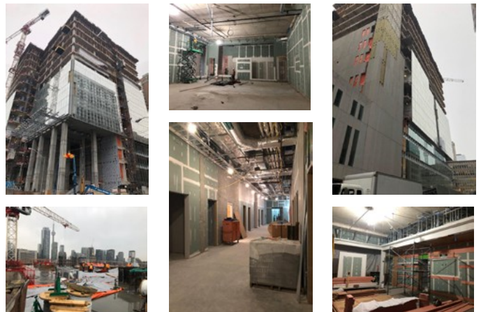
Le point sur le nouveau Palais de justice de Toronto | Hiver 2020-21

Le nouveau palais de justice de Toronto s'est transformé radicalement depuis le début des travaux de construction. Voir l'image de l'avancement des travaux ci-dessous.