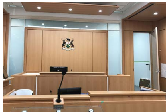
Mise à jour sur le nouveau Palais de justice de Toronto | Hiver 2019